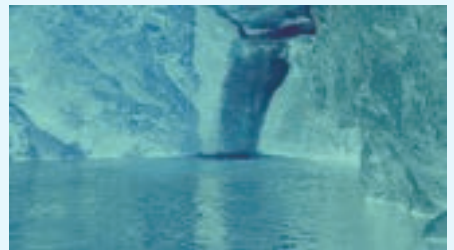
三宅砂織 Nowhere in blue, Single channel video, 20min loop, 2023

企画 | One Art Project 協力 | Barrack 助成 | 茨木市文化振興財団活動発展助成対象事業